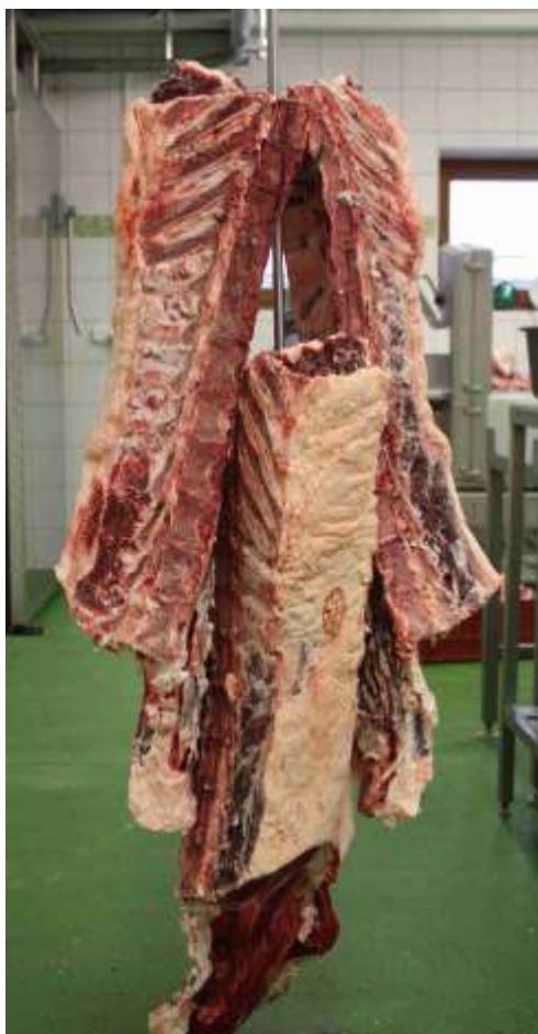
Vyzrálé maso před porcováním a balením

Ilustrační foto : vakuově balené maso zpracované do spotřebitelských balíčků 0,3 – 1,5 kg, vybrané partie vhodné na přípravu steaků jsou naporcovány na 250 – 800g steaky