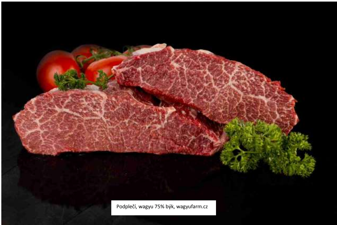
Podplečí, wagyu 75% býk, wagyufarm.cz