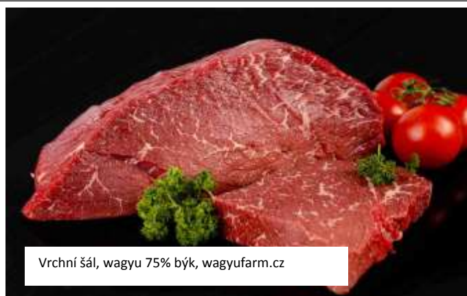
Vrchní šál, wagyu 75% býk, wagyufarm.cz