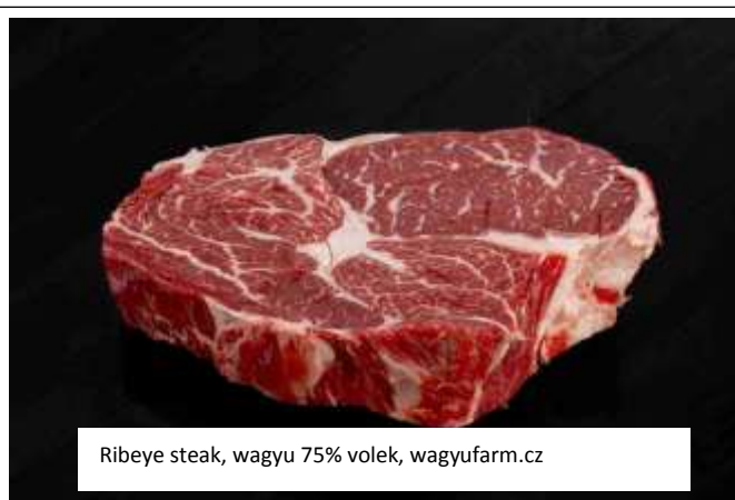
Ribeye steak, wagyu 75% volec, wagyufarm.cz