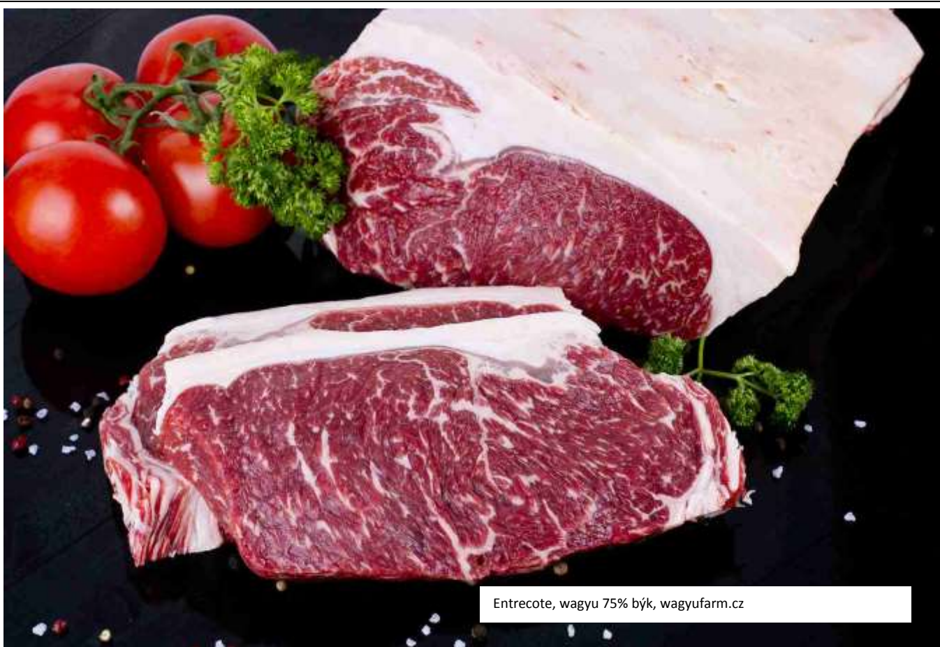
Entrecote, wagyu 75% býk, wagyufarm.cz